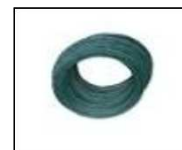
pvc žica - 125.90/kg